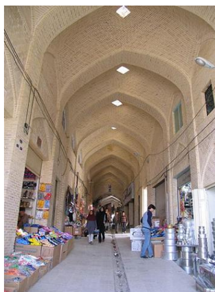
شکل ۱: بازار سنتی کرمانشاهنونه ای از فرهنگ مدنی و فرهنگ تاریخی شکل ۲: همگرایی فضای شهری و زندگی اجتماعی