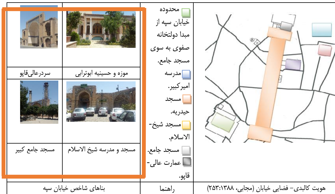
جدول ۲. معرفی خیابان سپه و بناهای شاخص آن (نگارندگان)