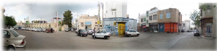
تصویر ۲. دید پانوراما از امامزاده آمنه خاتون.