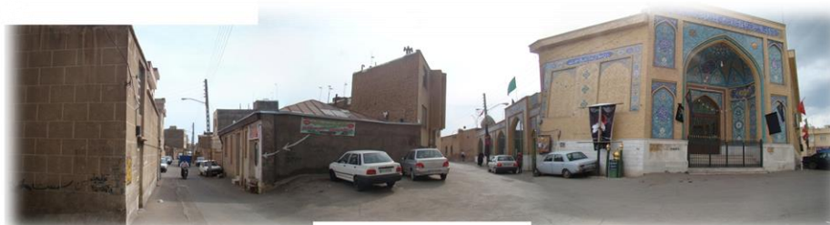
تصویر ۱. دید پانوراما از امامزاده علی (ع).

نقشه ۳: راهنمای نوع کاربری محله پنبه ریس قزوین.