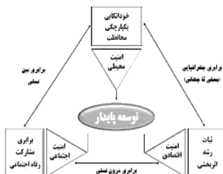
نمودار ۱. ساختار نظریه پایداری.

دسترسی پایدار شهری که موجب حفظ، افزایش و تقویت قابلیت‌های تحرک اجتماعی می‌شود. - زندگی پایدار شهری موجد یک شهر زنده، پویا و شاداب. - مردم سالاری پایدار شهری موجد توانمند سازی حقوق و هزینه شهروندی. - حکمروایی مناسب موجد مشارکت مردم در تصمیم‌گیری‌ها (احمدی، ۱۳۸۷). بنابراین یک الگوی توسعه ی پایدار شهری باید قابلیت سازگاری و انطباق را در زمان تغییرات اجتماعی و اقتصادی و ارزش‌های فرهنگی جامعه داشته باشد. که با وجود این جمعیت به عنوان مولفه اصلی در پایداری مطرح است، باید چگونگی