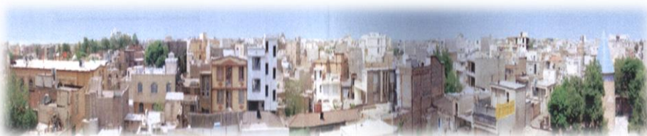
تصویر ۳. دید پانورامای محور از آرامگاه حمداله مستوفی تا امامزاده علی (ع)

عوامل موثر در توسعه بافت محدوده طرح به شرح ذیل می باشد: